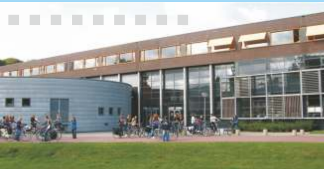
Het Rhedens Dieren

Het schoolgebouw in Dieren is pas een paar jaar oud, alles ziet er modern en kleurig uit. We willen dat iedereen zich thuis voelt en daarom hebben we de school opgedeeld in kleinschalige afdelingen. Deze hebben allemaal een eigen afdelingsleider maar ook een eigen plek binnen het gebouw. Dit maakt het geheel overzichtelijk en geeft je het idee dat je op een kleine school zit.