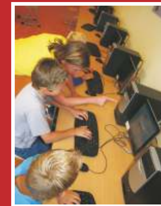
Welkom in ons computercentrum!

Het Rhedens Dieren biedt dansworkshops aan in samenwerking met dansschool Atelier Velp. Alle brugklassers van mavo en vmbo-kl krijgen gedurende enkele weken deze lessen aangeboden. Wie belangstelling én talent heeft, komt in aanmerking voor de vooropleiding Podiumkunsten voor de bovenbouw van vmbo-kl en de mavo, en/of voor de talentgroep Dans. Overigens komen ook leerlingen van andere leerjaren en niveau's in aanraking met dansworkshops.