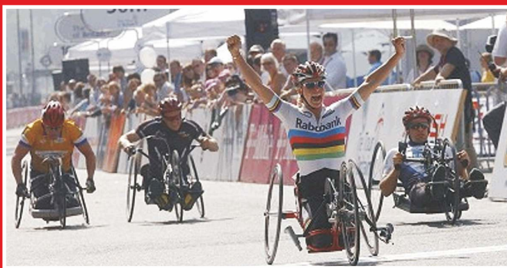
De afgelopen acht jaar eindigde zij bij alle wedstrijden waaraan ze deelnam bij de eerste drie.

*) vóór alle mannelijke deelnemers; 4 km zwemmen, 180 km handbiken, 42 km wheelen